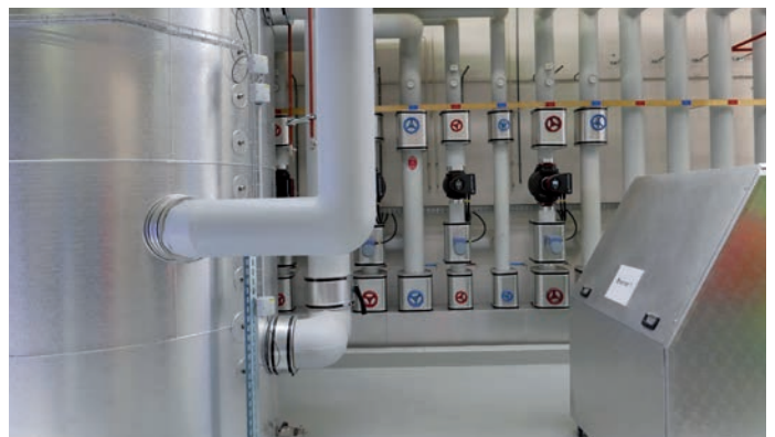
Der 7000-Liter-Wärmespeicher – das Herzstück der neuen Heizzentrale – speichert die Abwärme des Druckluftkompressors und aus der katalytischen Nachverbrennung.

Im Cellpack-Werk in Villmergen haben verschiedene, international tätige Geschäftsbereiche der Unternehmergruppe Behr Bircher Cellpack (BBC) Group den Produktionsstandort in der Schweiz. Cellpack Kunststofftechnik ist als Fertigungs- und Outsourcingpartner ein führender Anbieter in der Bearbeitung und Anwendung von technischen Kunststoffen. Cellpack Packaging entwickelt und produziert mit modernsten Anlagen und Methoden flexible Verpackungen aus Mono- und Mehrschichtfolien für Lebensmittel, technische Füllgüter etc. Daneben ist die BBC Group im Markt für Kabelverbindungssysteme (Cellpack Electrical Products), Energieverteilanlagen (Cellpack Power Systems), in der Medizintechnik (Cellpack Medical) sowie in den Bereichen Sicherheits- und Sensorsysteme (Bircher Reglomat) sowie Engineering- und Steuerungsbau (Bircher ProcessControl) tätig. Die BBC Group erwirtschaftet mit 1200 Vollzeitstellen einen Umsatz von rund 300 Millionen Franken.